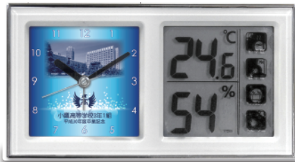
ルミエール (ブルー)