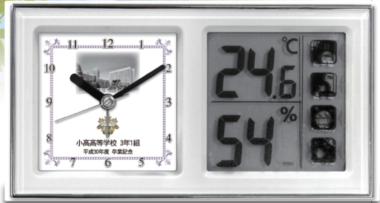
パープルフレーム