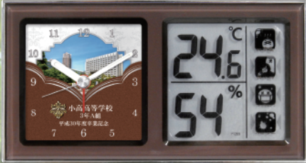
アワードプレート

【本体色】 ホワイト・ブラウン ※時計機種色は、ホワイト・ブラウンの2色からお選びいただけます。 【主な仕様】 アナログクォーツ時計・音の静かな連続秒針・電子音アラーム付・デジタル表示高精度の温度&湿度計・熱中症、食中毒、インフルエンザ、カビ、ダニ等の発生を注意表示する機能付 ・温度測定精度：±1℃ (-9.9～50℃) ・湿度測定精度：±3%RH (25℃・60%RHにおいて/20～95%) ・室内環境注意報 (LCD表示) 【使用電池】 単3形×2 【外形寸法】 86×160×48mm